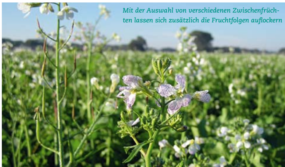
Abb. 1: Gräser und Zwischenfrüchte liefern Humus