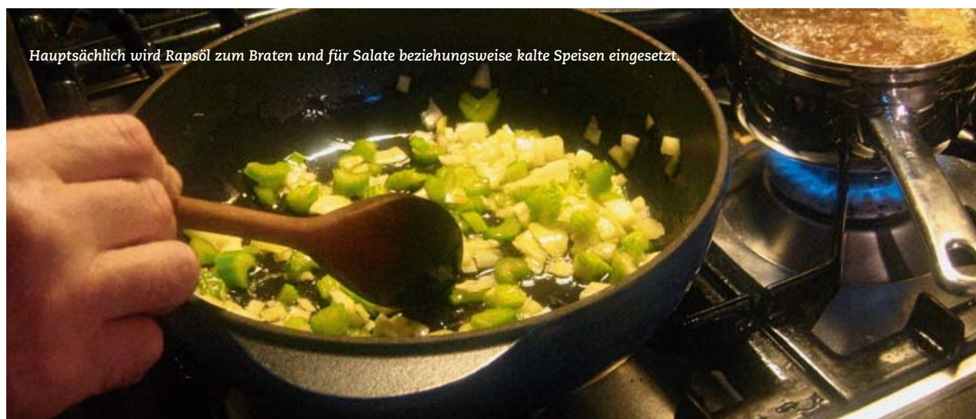
Hauptsächlich wird Rapsöl zum Braten und für Salate beziehungsweise kalte Speisen eingesetzt.